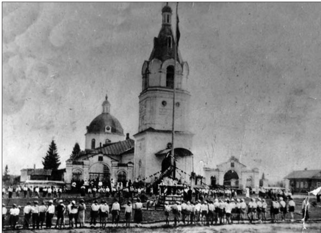
Фотография Троицкой церкви села Боровица (1936 год, из архива школьного музея «История посёлка Безбожник»)