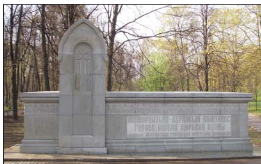
Стела «Мемориально-парковый комплекс героев Первой мировой войны»

Стела «Мемориально-парковый комплекс героев Первой мировой войны» установлена у главного входа в парк со стороны метро Сокол. Представляет собой стену из светло-серого камня. В левой части — обелиск с изображённым на нём православным крестом. На стене крупным шрифтом нанесена надпись: «Мемориально-парковый комплекс героев Первой мировой войны. Бывшее Московское городское Братское кладбище» .