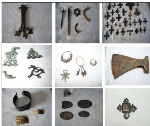
Жижец. Предметы из частной коллекции А.А. Хромова. Фото А. Плысык, 2014 год

Жижец, как и другие русские города, оставил свой след в истории нашего государства: здесь бывали киевская княгиня Ольга и князь Александр Невский; здесь жили люди, трудились, торговали, строили укрепления, защищали свой город и страну. О многом из истории города могут рассказать предметы быта,