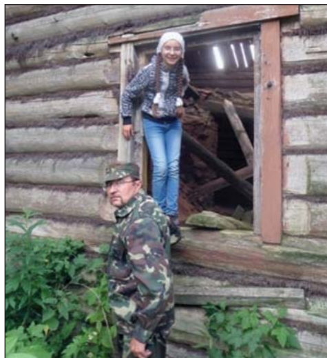
На пороге отчего дома...