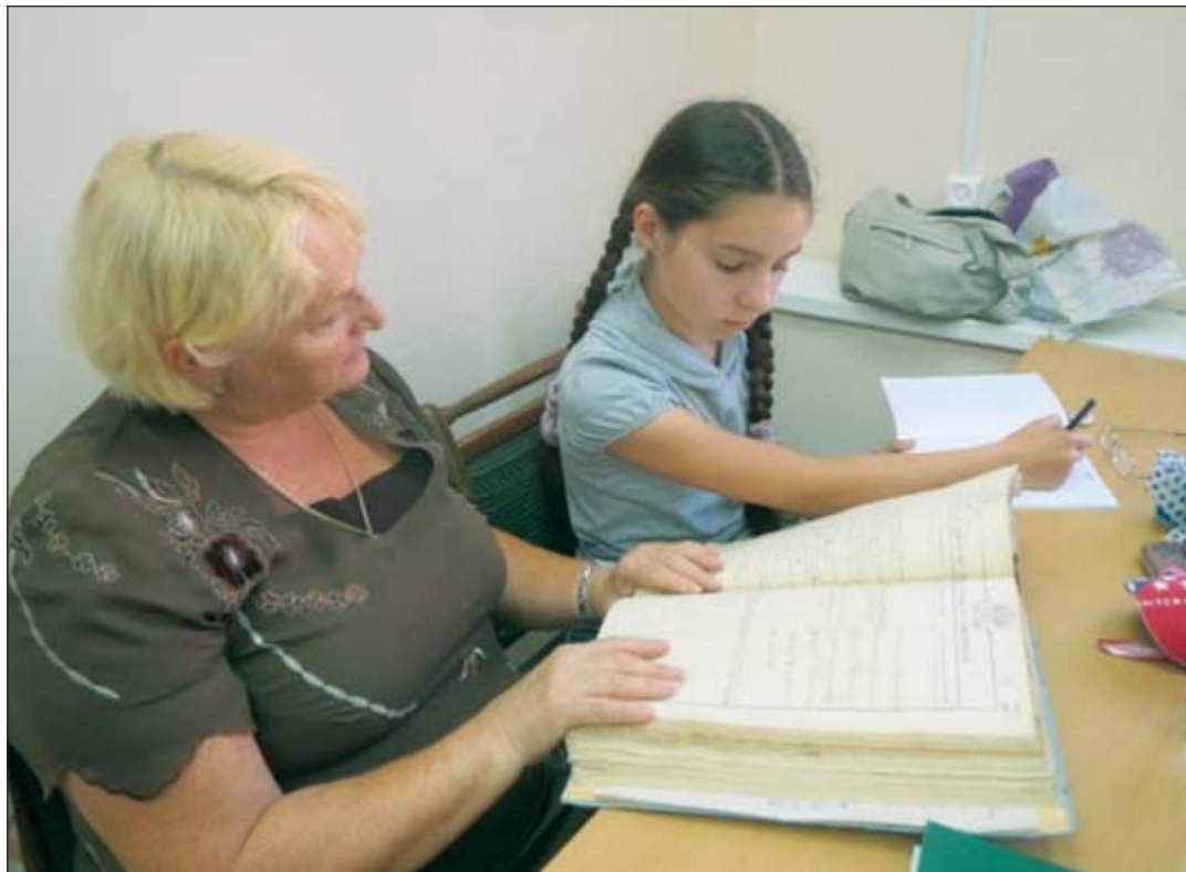
Занятие в Государственном архиве (июнь 2013).