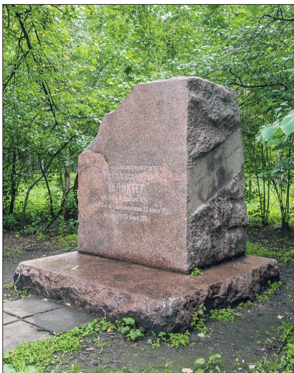
Надгробие на могиле С.А. Шлихтера

Надгробие на могиле С. А. Шлихтера — это единственное сохранившееся надгробие Братского кладбища. Расположено возле центральной клумбы парка. Студент Московского университета и георгиевский кавалер Сергей Шлихтер был ранен в 1916 году в бою под Барановичами и скончался по пути в Москву от припадков удушья. Массивный камень из красного гранита был установлен на его могиле в начале 1920-х годов. Автор — скульптор С.Д. Меркуров.