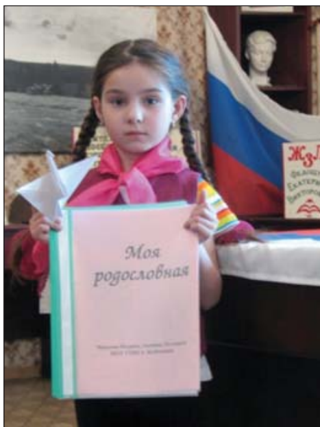
В школьном музее. Выступление на классном часе «Моя родословная».

Одним из моих увлечений является изучение истории моей семьи. Приезжая к бабушке в деревню, с интересом слушала рассказы о её детстве, о жизни в годы войны. Бабушка с сожалением, со слезами в голосе говорила о том, что многих своих родственников она уже и не помнит. В семье не было человека, который записал бы историю семьи. Это и явилось причиной появления данного исследования. Чем больше накапливалось материалов, тем больше становилось понимание, что данная тема важна не только для нашей семьи, но и в целом для исторической науки. История Родины становится более яркой и понятной именно через семейные биографии.