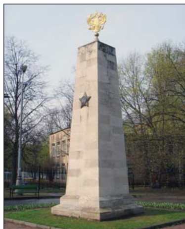
Обелиск «Павшим за свободу и независимость Родины»

Обелиск «Павшим за свободу и независимость Родины» расположен на юге парка в центре круглой клумбы. От неё берёт начало центральная аллея, пересекающая парк с юга на север по прямой. Обелиск венчает позолоченный двуглавый орёл. На лицевой грани выгравированы слова: «Павшим за свободу и независимость Родины» . На трёх других гранях скульптурные изображения воинских наград. Среди них Георгиевский крест, звезда к ордену Святого Георгия, а также орден Красной Звезды.