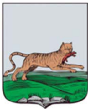
Герб Иркутска (1790)

На старинном гербе Иркутской губернии (1690, 1790 гг.) был изображён бабр (так раньше называли уссурийского тигра), держащий в пасти соболя.