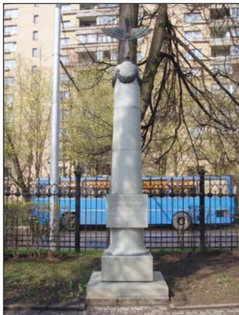
Памятник российским авиаторам