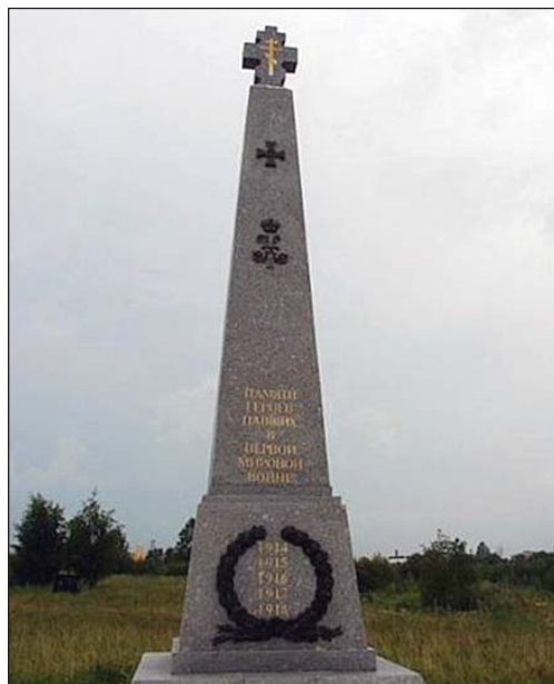
Памятник героям Первой мировой войны в г. Пушкин

Памятник русским воинам, погибшим в годы Первой мировой войны, установлен к 90-летию оконча-