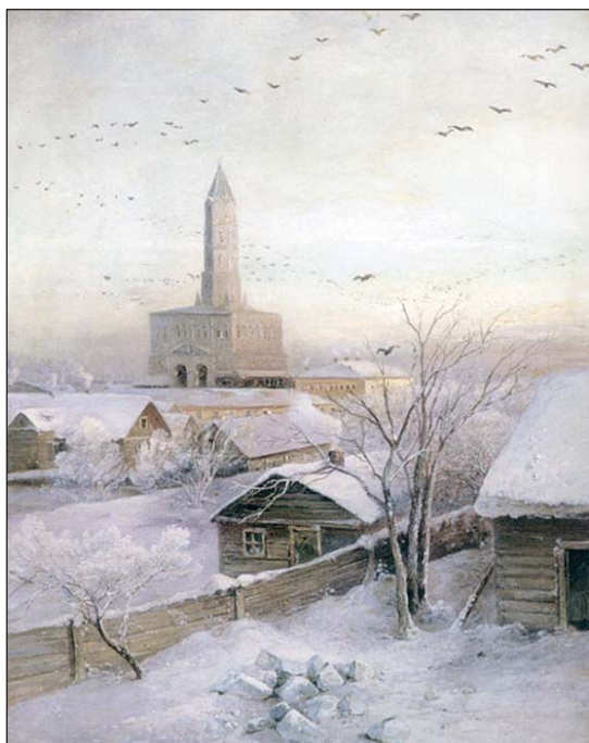
Алексей Саврасов. Сухарева башня.

Москва. 1872. Государственный исторический музей