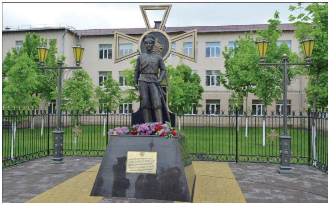
Памятник героям Первой мировой войны в г. Новочеркасске

корпуса. Участвовать в торжестве пригласили ветеранов войн и казаков.