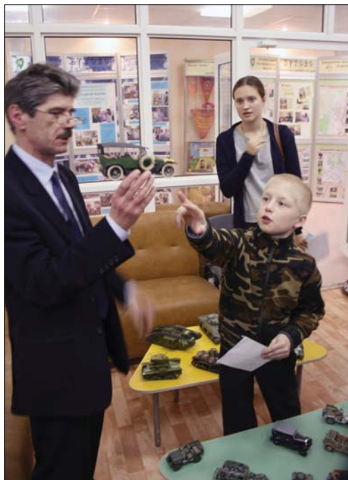
Экспонат музея — машина Первой мировой войны

После того как все задания были выполнены и найдены артефакты, среди которых были очень разные, но ценные и интереснейшие экспонаты, имеющие отношение к Первой мировой войне, состоялась церемония награждения лучших команд игры «Музейный лабиринт». Первое место заняли команды музея «От Сталинграда до Вены» (ГБОУ СОШ №780 «Гармония») и лицея № 1561, второе место досталось музею «Вечный огонь на земле Юго-Запада» (ГБОУ Школа № 2109) и музею ГБОУ Школа № 1161 (СП 2049), почётное третье место разделили музей боевой славы, посвящённый жителям района Ясенево — ветеранам ВОВ (ГБОУ СОШ №1206) и музей боевой славы 67-й механизированной танковой бригады (ГБОУ Школа