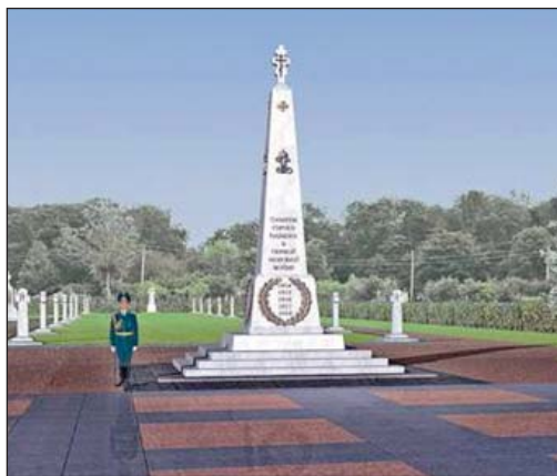
Царскосельское Братское кладбище героев Первой мировой войны