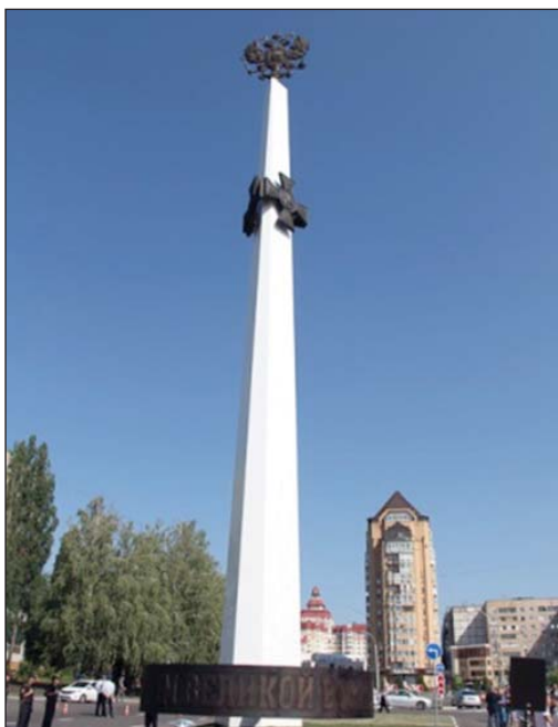
Памятник героям Первой мировой войны в г. Липецке