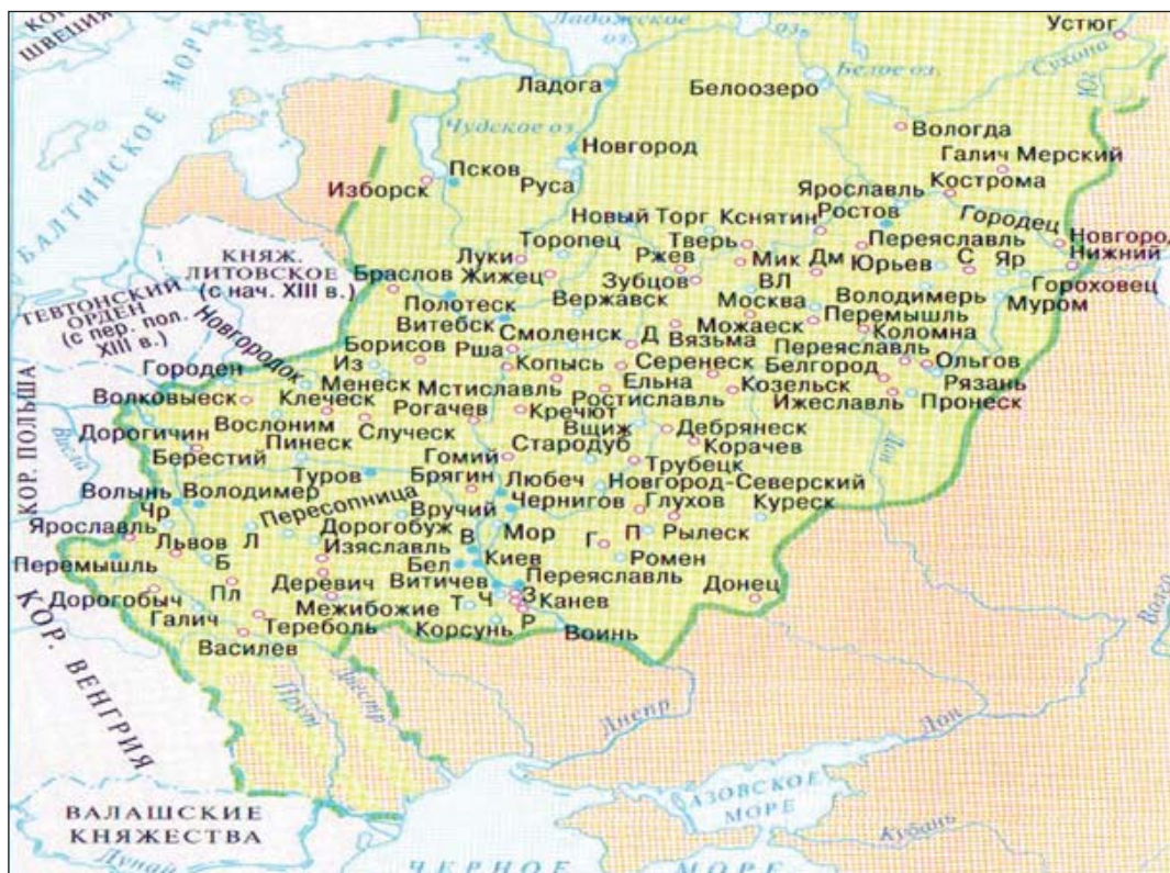
Город Жижец на карте «Древнерусские города X–XIII вв.»

Н.С. Новиков — Молитва Мусоргского), ресурсы Интернета. Встречались и беседовали с работниками музея М.П. Мусоргского, с местными жителями, побывали на городище, исследовали, замерыли, сфотографировали.