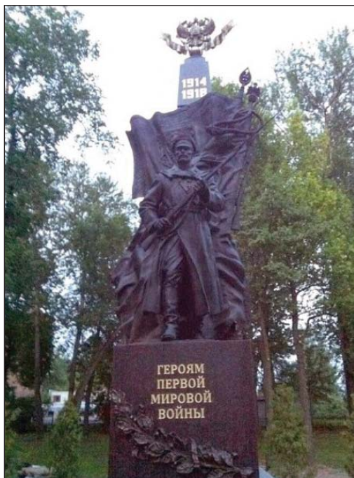
Памятник героям Первой мировой войны в г. Пскове

Памятник установлен в год столетия с момента начала Первой мировой войны, посвящён памяти русских солдат и офицеров, павших в боях этой войны. Создан по инициативе Российского военно-исторического общества. Победителем проведённого обществом конкурса стал Народный художник Российской Федерации Салават Щербаков. Торжественное открытие памятника состоялось 22 августа 2014 года на бульваре между автобусным и железнодорожными вокзалами Пскова. В церемонии открытия приняли участие заместитель председателя Правительства Российской Федерации Ольга Голодец, командующий Воздушно-десантными войсками России Владимир Шаманов, губер-