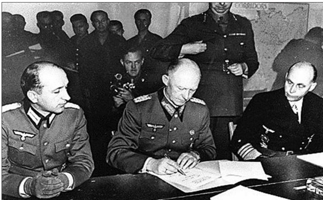
Подписание акта о безоговорочной капитуляции Германии

Самым значительным событием в истории XX века стала победа в Великой Отечественной войне 1941-1945 годов. Выстоять и победить суждено было именно Советской России, нашему народу. Великая Отечественная война стала переломным этапом в духовной жизни нашей страны. Когда встал вопрос о выживании народа, то политика советского государства по отношению к православной вере изменилась, государство стало меньше преследовать верую-