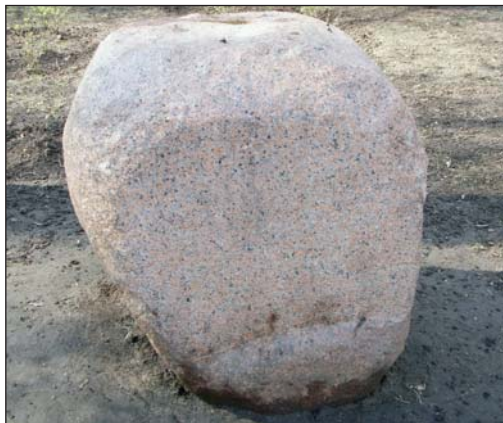
Закладной камень Братского кладбища

Закладной камень Братского кладбища был установлен 27 сентября 1992 года на центральной клумбе парка. Автор памятника — скульптор В.М. Клыкков. На гранитном камне была надпись: «На этом месте будет сооружен памятник всем россиянам, павшим в войне 1914–1918 годов. Память народа священна» . В 2004 году во время благоустройства парка закладной камень был перемещён к главному входу. Надпись на камне со временем утрачена.