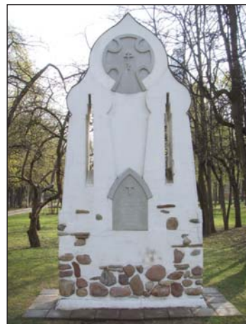
Памятный знак на месте снесённой часовни

Памятник российским сёстрам милосердия установлен в северной части парка неподалёку от обелиска «Павшим в Мировой войне 1914-1918 годов». Напротив него — небольшая круглая клумба. Памятник представляет собой каменный обелиск. В верхней части имеет форму купола, на котором изображён медицинский крест. В центральной части — узорчатый рисунок и надпись: «Российским сёстрам милосердия» .