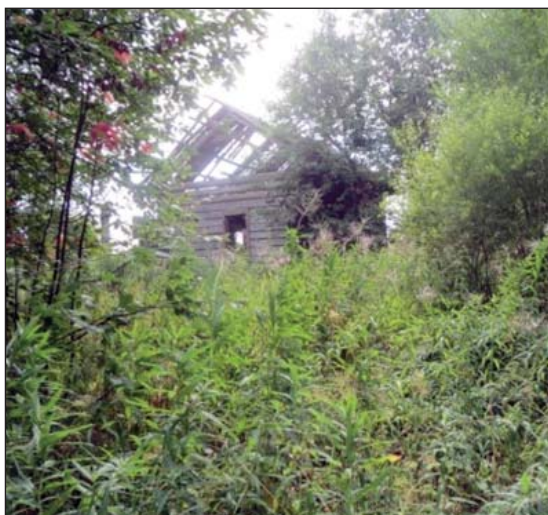
Вот он дом деда и прадеда...