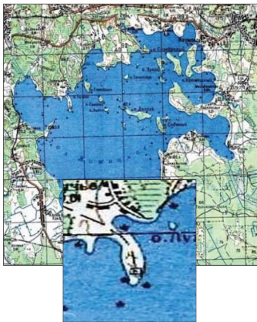
Карта Жижицкого озера и полуострова, на котором находился древний город Жижец

По преданию, киевская княгиня Ольга посетила эти места. В 961 году был основан погост Жижец. Погосты созданы в 947 году киевской княгиней Ольгой в землях, подчинённых Киеву славянских племён, — места для сбора дани (полюдья). Однако первоначальное значение слова «погост» происходит от старинного слова «гость». Так здесь называли купцов, проезжавших «погостить» со своими товарами. По мнению некоторых учёных, по реке Кунья и через Жижицкое озеро наметилось одно из направлений торгового пути «из варяг в греки». «От Ловати вверх по р. Кунье до с. Клина, и оттуда уже волоком (через Городец к югу от Клина) на город Жижицы или Жижчь (там, где теперешнее селение Жесцо-Живец, близ запад-