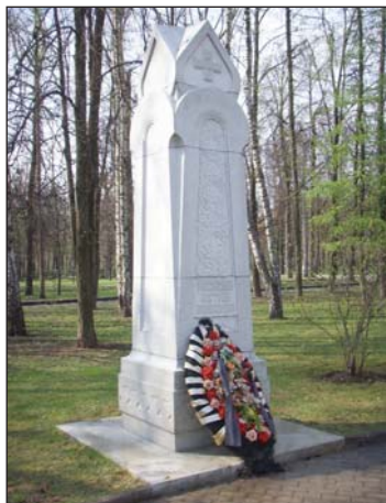
Памятник российским сёстрам милосердия