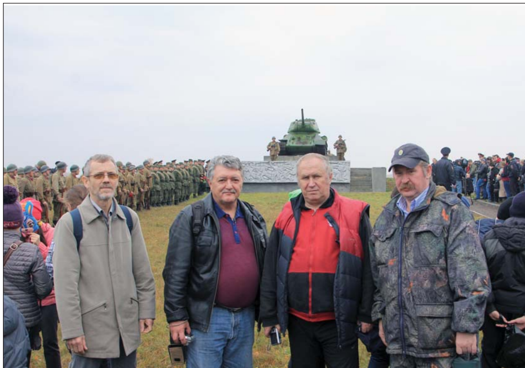
Бородинское поле 12 октября 2014 г. Среди друзей