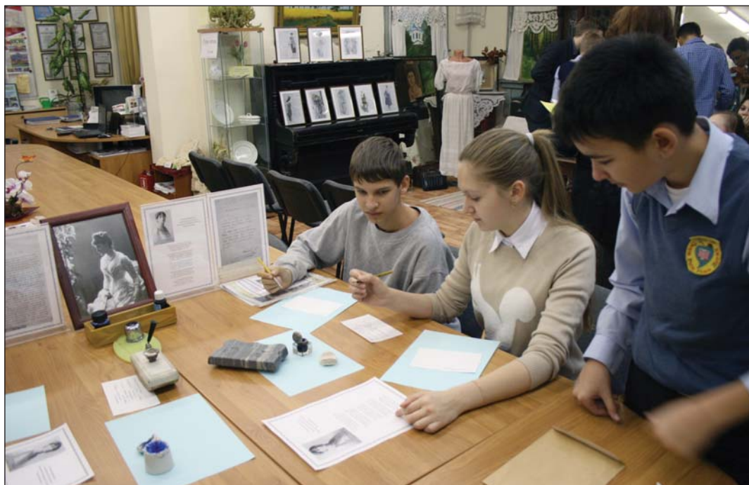
На одном из этапов исследовательской игры «Музейный лабиринт»

Первой мировой войны. Чтобы его найти, необходимо было пройти все 13 этапов, на которых дети смогли познакомиться с событиями, людьми, вещами Первой мировой войны и получить фрагмент «карты». Соединив все фрагменты, участники увидели фотографию того артефакта, который они искали.