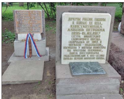
Памятные плиты у могилы С.А. Шлихтера