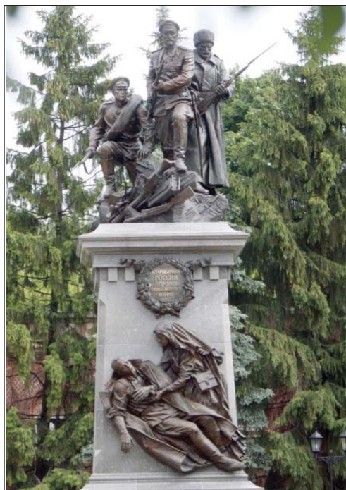
Памятник героям Первой мировой войны в г. Калининграде